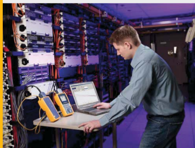
将 DTX-1800 与 DTX 万兆套件配合使用来测试外部串扰性能